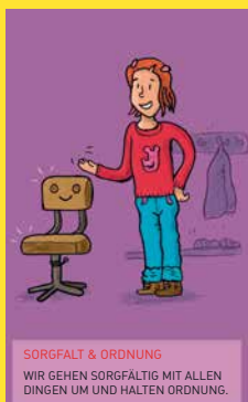
SORGFALT & ORDNUNG WIR GEHEN SORGFALTIG MIT ALLEN DINGEN UM UND HALTEN ORDNUNG.