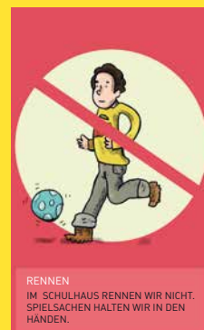
RENNEN IM SCHULHAUS RENNEN WIR NICHT. SPIELSACHEN HALTEN WIR IN DEN HÄNDEN.