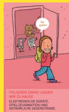
FOLGENDE DINGE LASSEN WIR ZU HAUSE ELEKTRONISCHE GERÄTE, SPIELZEUGWAFFEN UND GEFÄHRLICHE GEGENSTÄNDE.