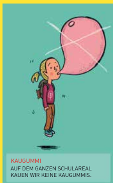
KAUGUMMI AUF DEM GANZEN SCHULAREAL KAUFEN WIR KEINE KAUGUMMIS.