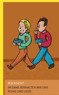
RÜCKSICHT IM GANG VERHALTEN WIR UNS RUHIG UND LEISE.