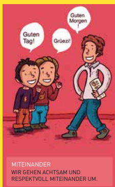
MITEINANDER WIR GEHEN ACHTSAM UND RESPEKTVOLL MITEINANDER UM.