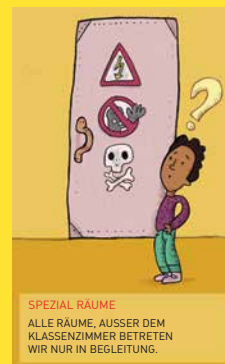
SPEZIAL RÄUME ALLE RÄUME, AUSSER DEM KLASSENZIMMER BETRETEN WIR NUR IN BEGLEITUNG.