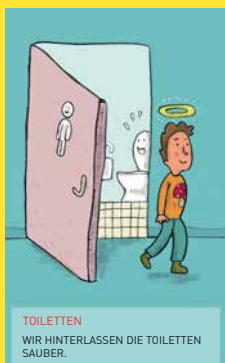
TOILETTEN WIR HINTERLASSEN DIE TOILETTEN SAUBER.